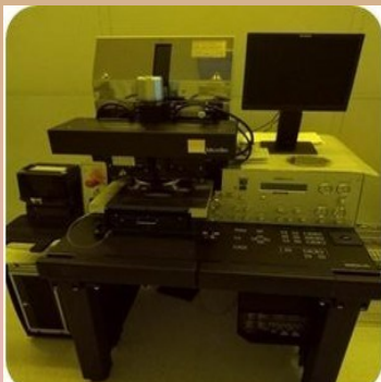
Mask Aligner MA6