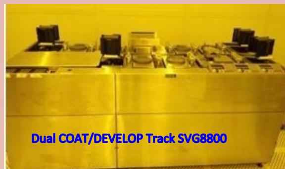
Dual COAT/DEVELOP Track SVG8800