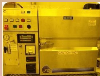
YES OVEN 6112